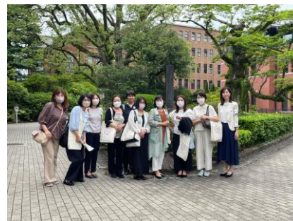
キャンパス散策の様子