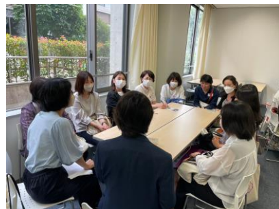
学年別座談会の様子