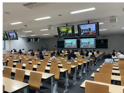
京都支部総会の様子